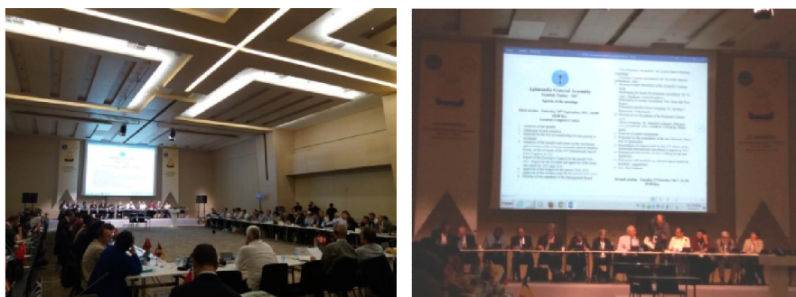
Εικόνα 5. Αποψη από τη Γενική Συνέλευση της ΑΠΙΜΟΝΔΙΑ

Με την ευκαιρία του Παγκόσμιου Συνεδρίου, γίνεται και η Συνέλευση των μελών της ΑΠΙΜΟΝΔΙΑ, καθώς και οι εκλογές νέων μελών στο Δ.Σ, του προέδρου και των μελών των Επιστημονικών Επιτροπών (Εικ. 5). Εγκρίθηκαν επίσης 19 νέα μέλη. Από τις εκλογές αναδείχτηκε νέος αντιπρόεδρος ο Peter Kosmus από την Σλοβενία. Επίσης από τις 4 χώρες που διεκδίκησαν της διοργάνωση του 47ου Συνεδρίου (Δανία, Ρωσία, Σερβία, Σλοβενία), νικήτρια αναδείχτηκε η Ρωσία με πολύ μεγάλη πλειοψηφία. Επόμενα το 2021 το παγκόσμιο μελισσοκομικό συνέδριο θα φιλοξενηθεί στην Ούφα του Μπασκορτοστάν. Το επόμενο ραντεβού μας όμως με την ΑΠΙΜΟΝΔΙΑ είναι το 2019, στο Μοντεάλ του Καναδά (όπως αποφασίστηκε το 2015 στην Ντεζέον).