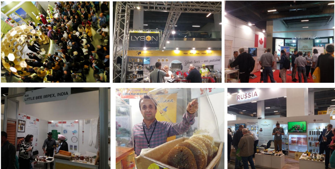
Εικόνα 2. Σκηνές από την Μελισσοκομική έκθεση