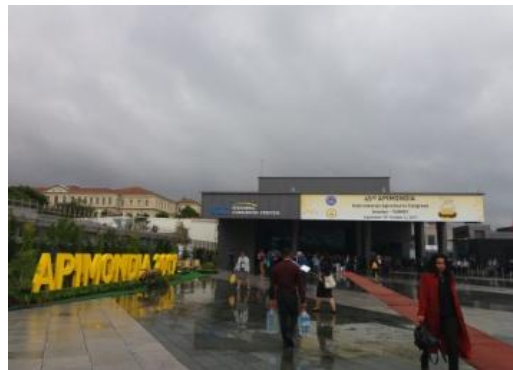
Εικόνα 1. Το Istanbul Congress Center με το χαρακτηριστικό σήμα της ΑΠΙΜΟΝΔΙΑ 2017

Φανή Χατζήνα, Τακτική Ερευνήτρια - Τμήμα Μελισσοκομίας- Ινστιτούτο Επιστήμης Ζωικής Παραγωγής- ΕΛΓΟ 'ΔΗΜΗΤΡΑ'